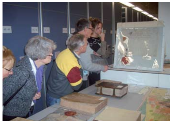
De groep bekijkt een proclamatie van Napoleon

Er was tijd voor een 'foto herkenningsoopdracht'. De dames hadden op verzoek van het Wijkberaad een 6 tal foto's van