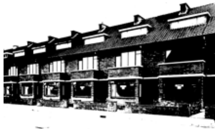
In de Goudreinetstraat kan men in de jaren vóór de oorlog uit de huizen nog kiezen. Dit zijn de huizen tegenover het 'landje' op de hoek van de Sterappelstraat.

eeuw de Petrakerk gestaan, maar dat was jarenlang de enige bebouwing aan die zijde. Een heerlijk 'landje' was ook de plek op de hoek van de Goudreinetstraat en de Sterappelstraat waar pas halverwege de jaren