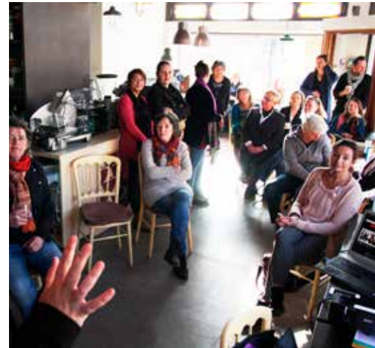
Een netwerkbijeenkomst op maandag in lunchroom Op de Hoek