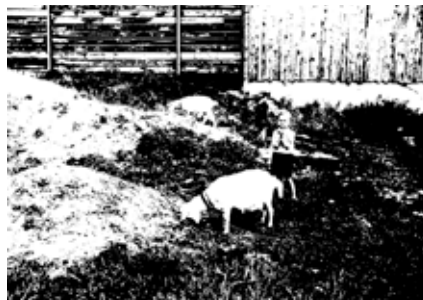
Op het landje bij de Sterappelstraat legde kapper De Vries nog eens twee zoons en twee geiten vast. Het was een zeldzaam plukje woestijn dat ooit tot de Kerketuinen had behoord. Inmiddels staan er al zestig jaar huizen.

Een spannende periode is de tijd geweest dat een nieuw blok portiekwoningen aan de zuidzijde van de Goudreinetstraat gebouwd werd. Het project betrof het gebied vanaf het pleintje bij de huidige Bosbeskapel tot