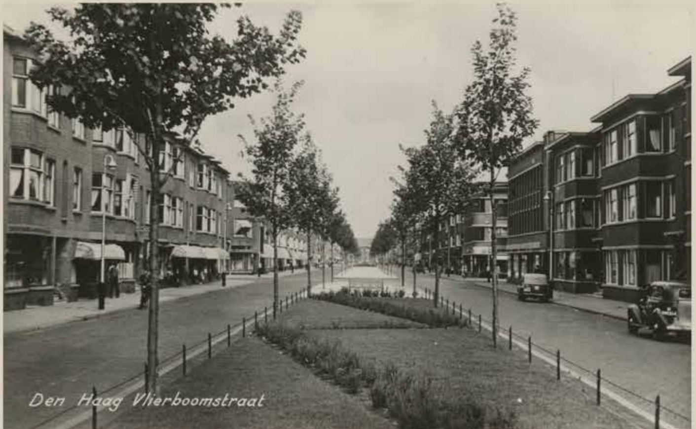
Den Haag Vlierboomstraat