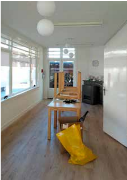
Fris in de verf