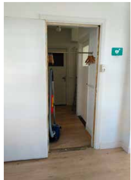
Een nieuwe toegang